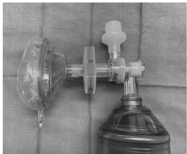
Figura 2. Dispositivo bolsa-válvula-máscara con filtro viral/bacteriano colocado.

Al momento de redactar estas recomendaciones, American Heart Association (AHA) no contraindica la ventilación manual, pero recomienda la colocación de filtros HEPA (virales) en toda bolsa-válvula-máscara. 11 El International Liaison Committee on Resuscitation (ILCOR) sometió a publicación un consenso basado en revisión sistemática de la literatura, el cual recomienda intentar la desfibrilación previo a cualquier procedimiento que pueda generar aerosoles (nivel de evidencia bajo), asimismo en los estudios clínicos analizados, no se ha encontrado mayor riesgo de transmisibilidad del patógeno (nivel de evidencia bajo). 12 Si bien otras asociaciones tienen criterios más restrictivos, 13 sugerimos seguir la normativa internacional de AHA, primando la seguridad de los operadores y miembros del equipo de reanimación. 10,11,14